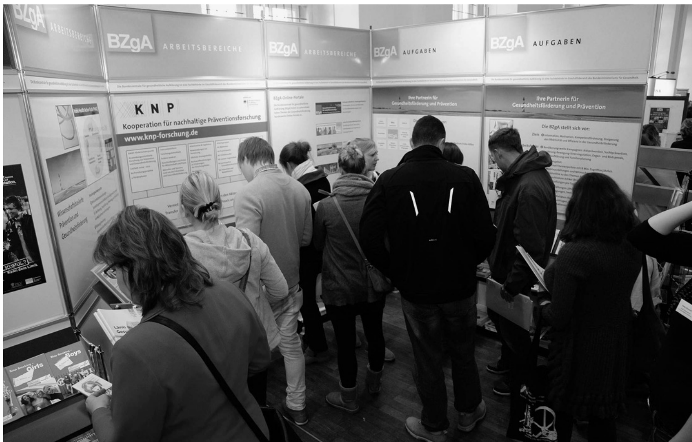
Impressionen vom Markt der Möglichkeiten